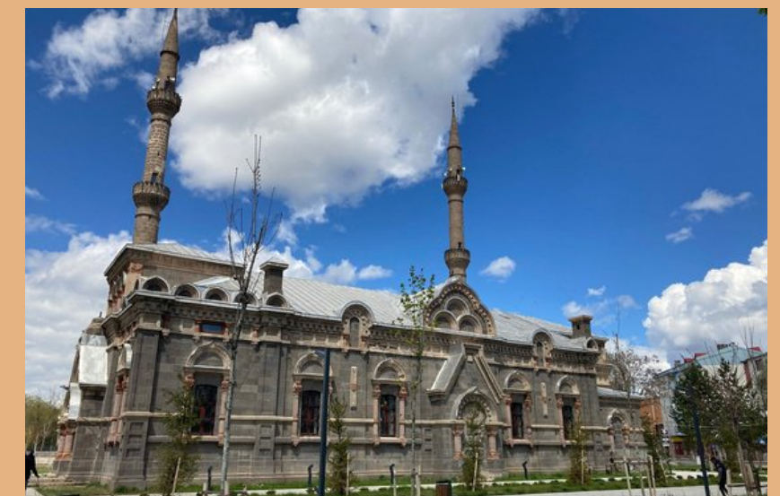
ПОИСКИ «РОССИИ, КОТОРУЮ МЫ ПОТЕРЯЛИ». МЕЧЕТЬ ФЕТХИЕ, БЫВШИЙ СОБОР СВ. АЛЕКСАНДРА НЕВСКОГО