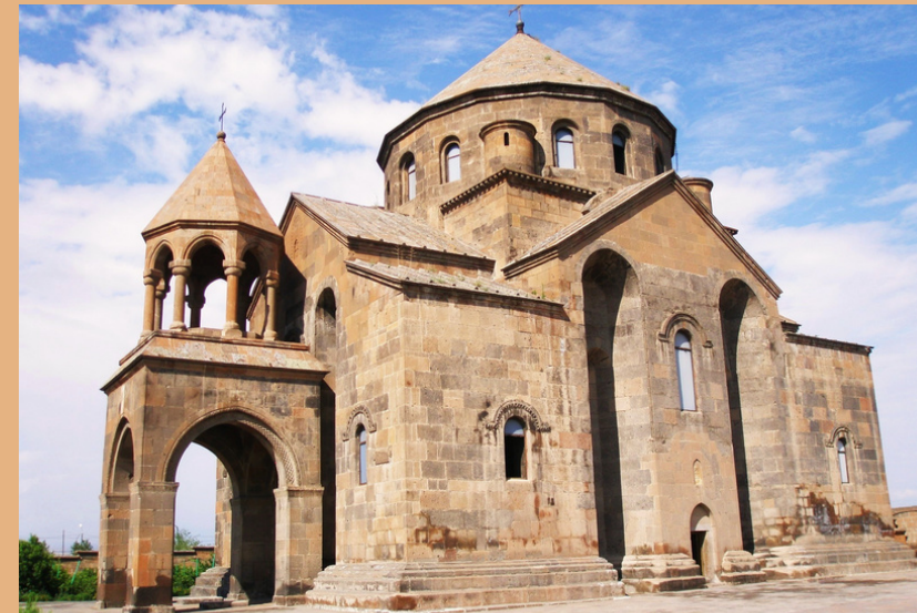
МИНИАТЮРНАЯ ЦЕРКОВЬ СВ. РИПСИМЕ