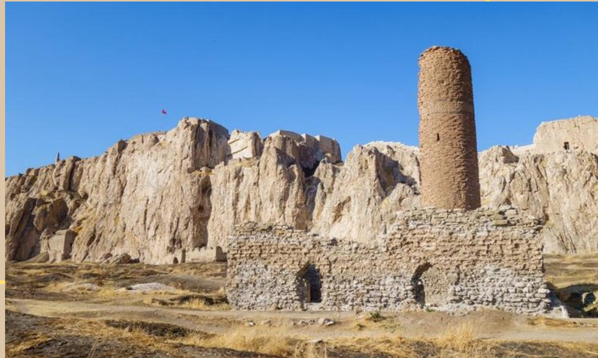
Руины старого Вана