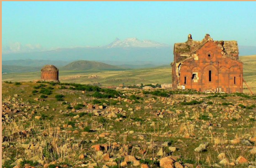
ДРЕВНИЙ ГОРОД АНИ