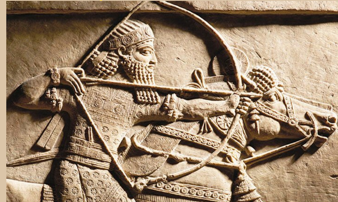
Археологический музей Урарту