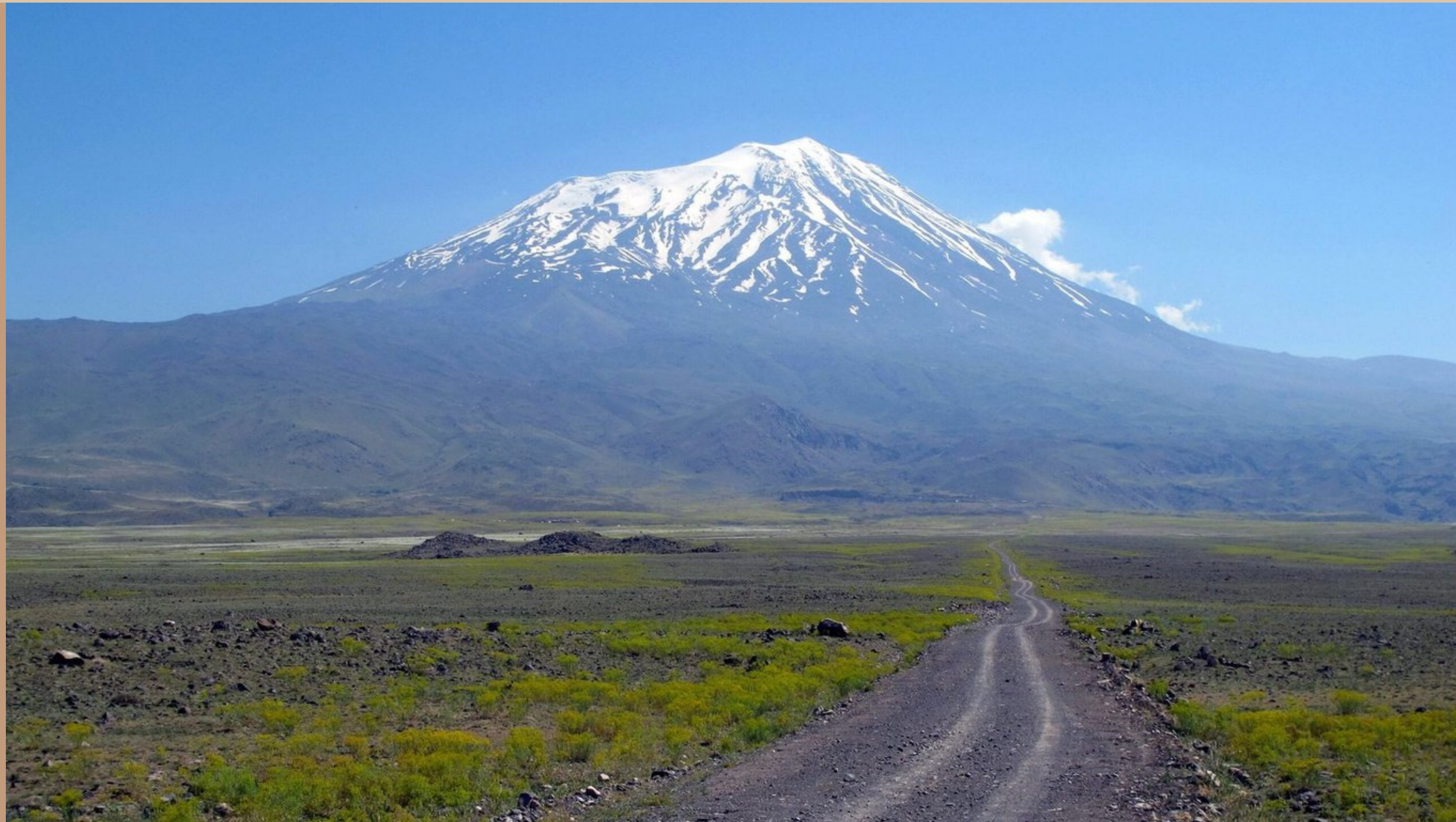
Вид на Арарат из Турции