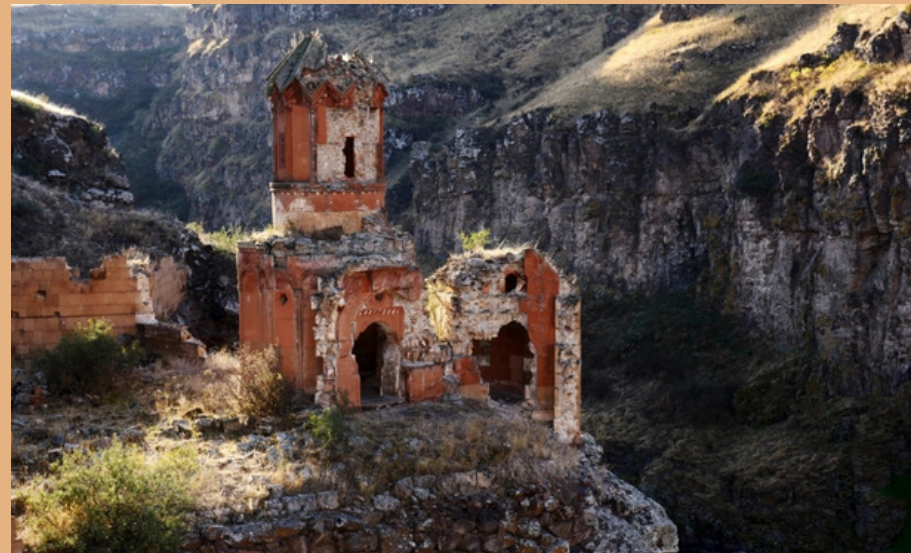
ЗАБРОШЕННЫЙ МОНАСТЫРЬ ДЕВСТВЕННИЦ