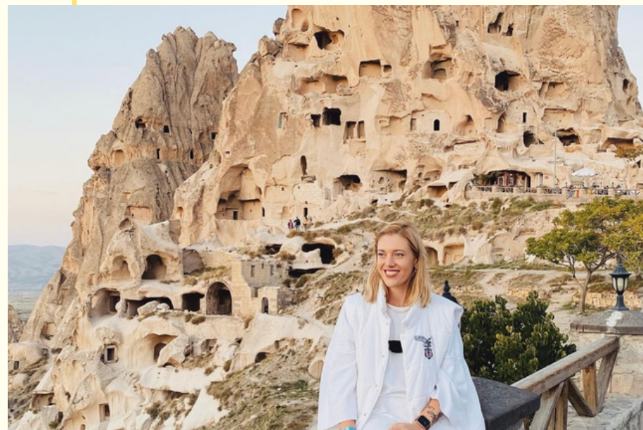
ПРИБЫТИЕ В КАППАДОКИЮ