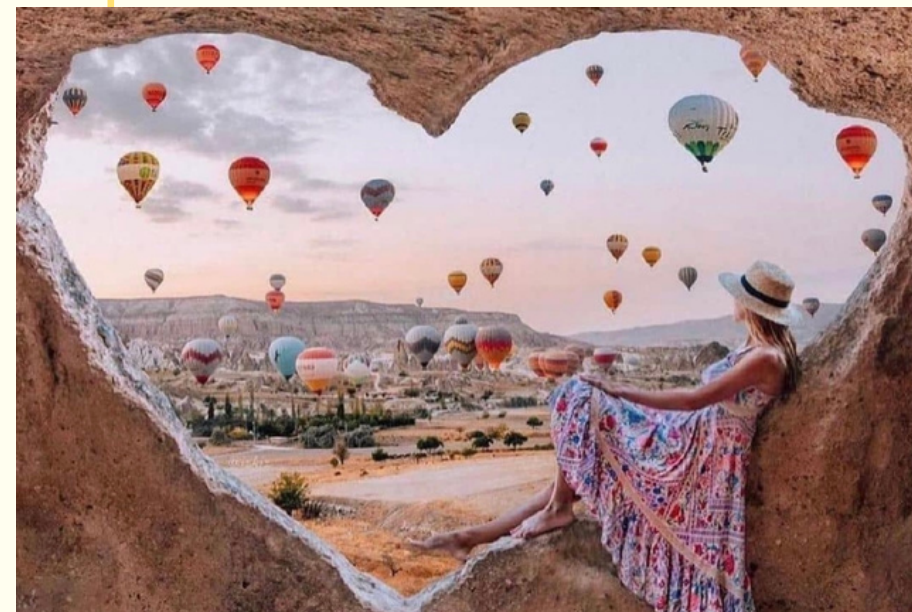
ТРАНСФЕР И ЗАСЕЛЕНИЕ В ОТЕЛЬ