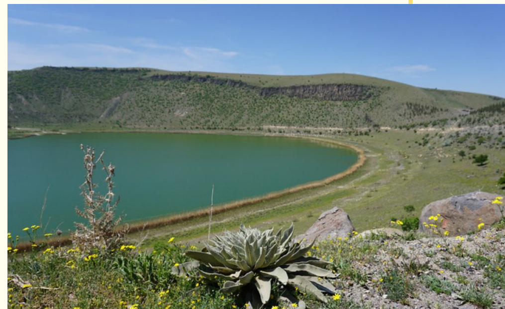
КРАТЕРНОЕ ОЗЕРО НАР С ТЕРМАЛЬНЫМИ ИСТОЧНИКАМИ