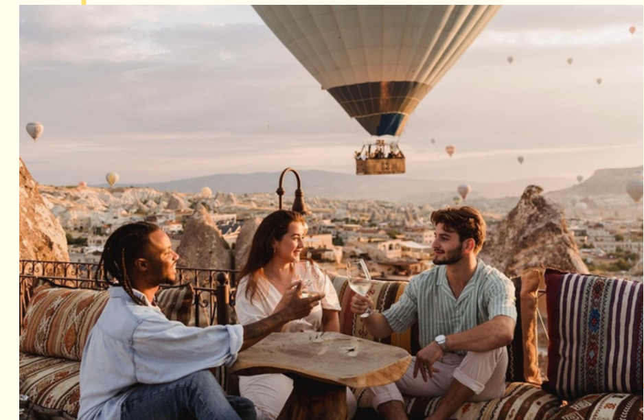
ЗНАКОМСТВО И УЖИН