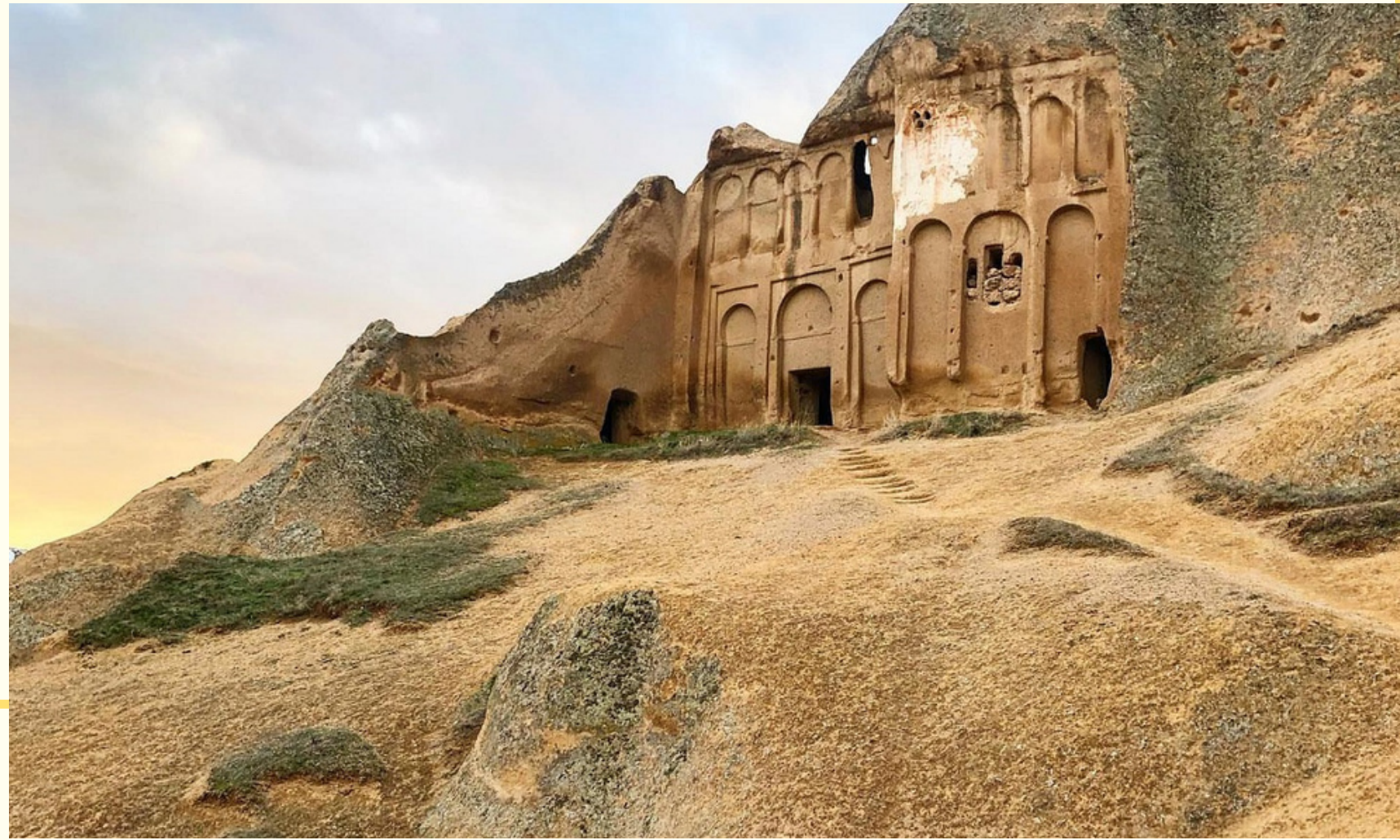
Пещерный монастырь и церковь Селиме