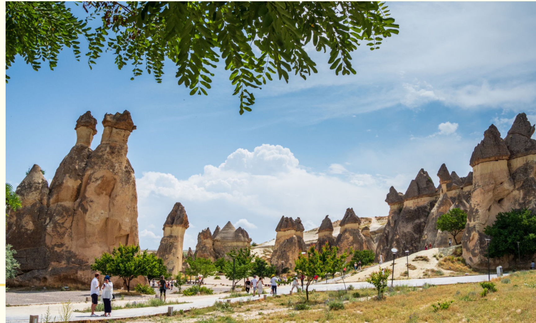
Пашабаг — долина Монахов