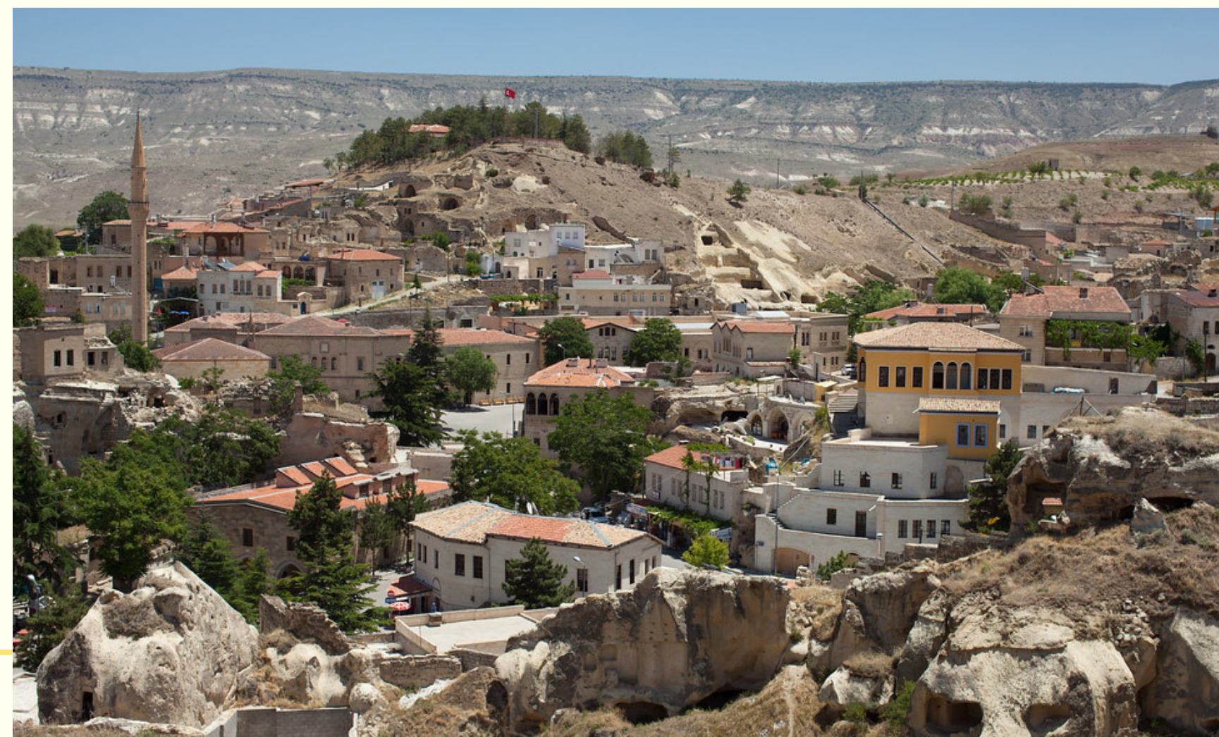
Старинная греческая деревня Синассос, ныне турецкий поселок Мустафаша