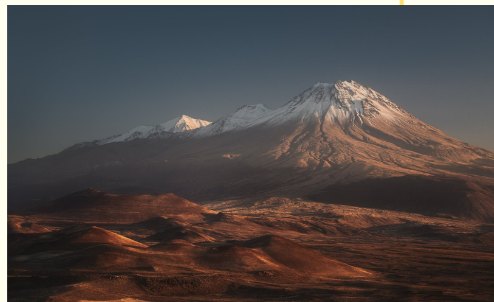
ПАНОРАМА ВУЛКАНА ХАСАНДАГ