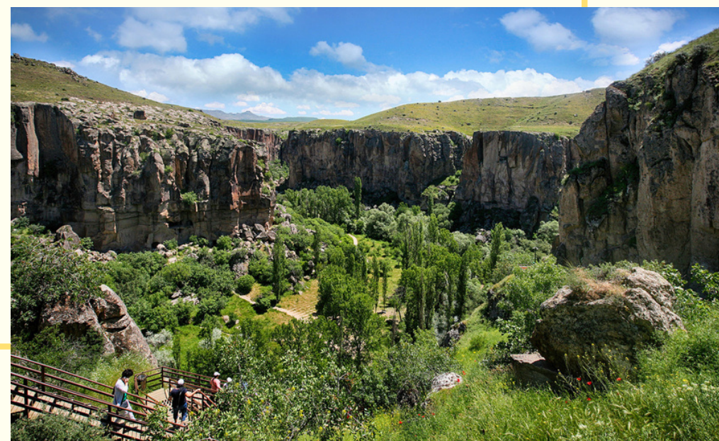
КАНЬОН БИХЛАРА, ПЕШАЯ ПРОГУЛКА ОТ 3 КМ