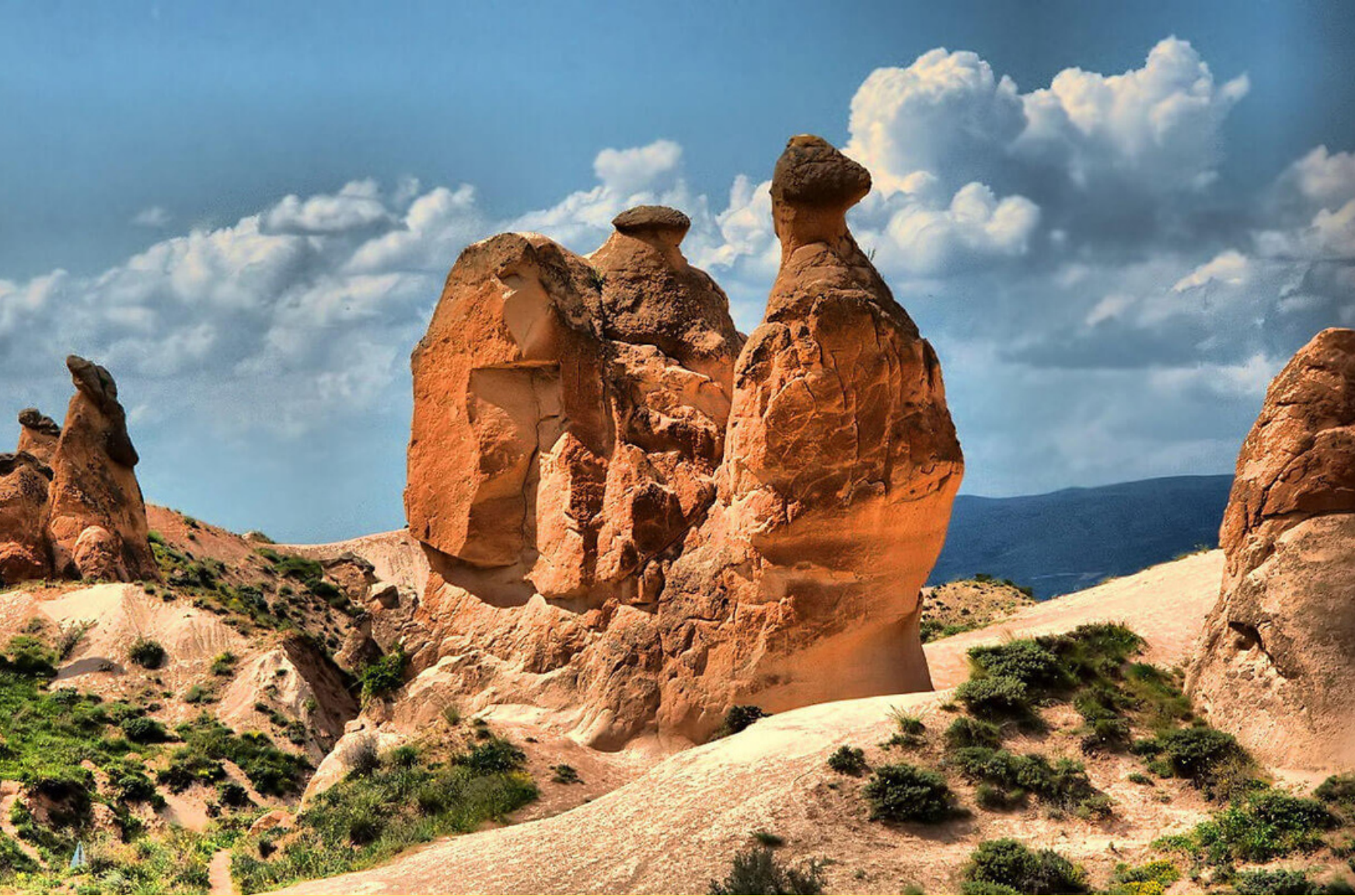
Долина воображения Деврент